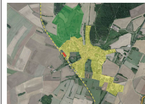
LEGENDE : Réservoir de biodiversité "Prairie et bocage" Site d'implantation du projet Barrière écologique (urbanisation, voie de chemin de fer)

Enjeux économiques Enjeux urbains Enjeux environnementaux